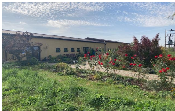
Současný stav ekocentra roku 2023