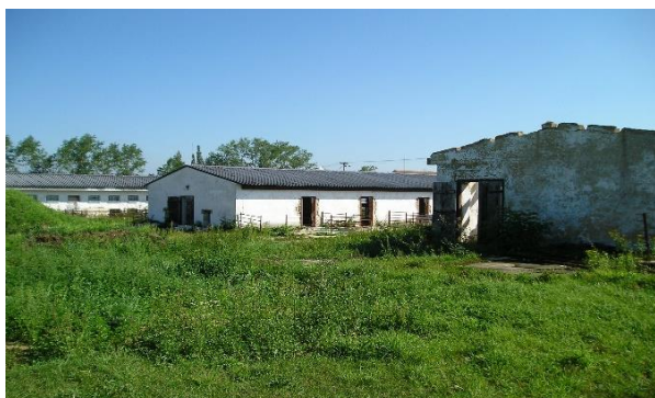
Původní stav ekocentra roku 2011